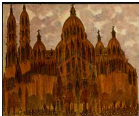
Marcel Storr , Untitled , 1964, pencil, colored ink and varnish on paper, 30 x 37 cm