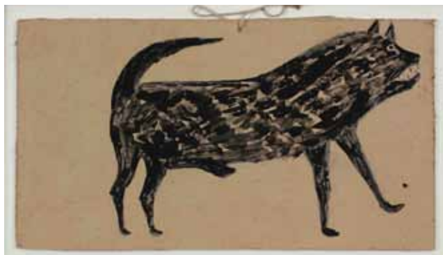
Bill Traylor , Untitled (Black Dog) , circa 1939-42, graphite and drybrush on color baby ruth showcard, 19x34,3cm