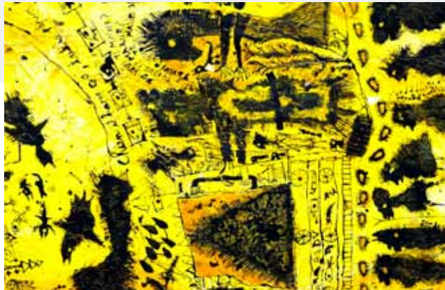
Azema , Pepin Pietri , technique mixte, 150 x 120 cm (détail 2), 2014