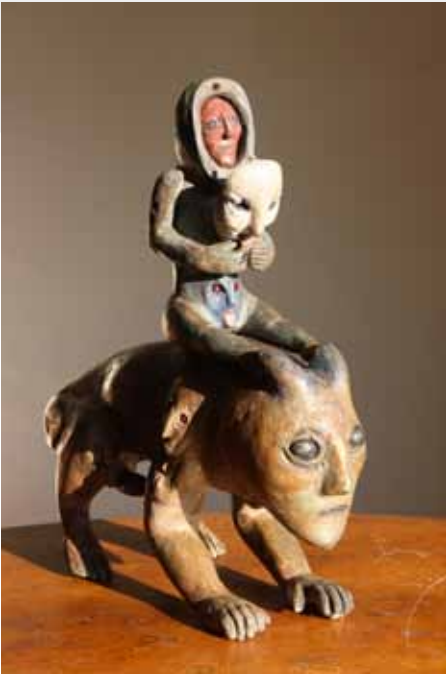
Richard C Smith, Untitled , 2014, sculpture from found wood, 40 x 40 cm