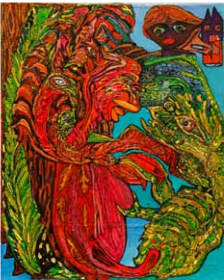
Ody Saban, Jouer avec les cordes vocales de la grenouille , 2013 81 x 65 cm acrylique sur toile