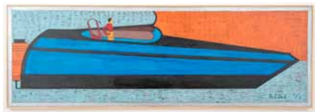
Alcide Pereira Dos Santos , Uma Lancha Cabina , 1995, acrylique sur toile, 73 x 216 cm