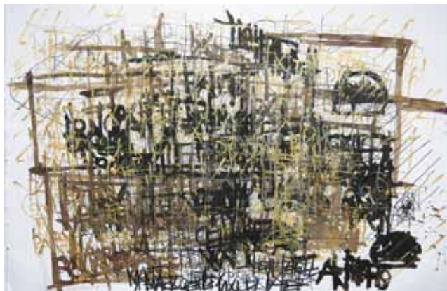
Dan Miller , Untitled , 2013, encre et acrylique sur papier, 30 x 44,5 inches