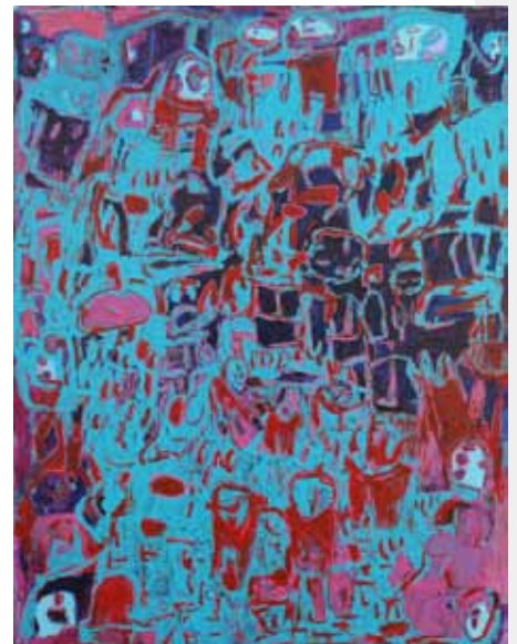
Donald Mitchell, Untitled , 2013, acrylique sur toile, 30 x 40 inches