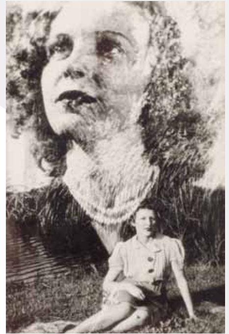
Eugène Von Bruenchenhein, Untitled ( Marie with pearls, sitting on grass montage ), circa 1940s, Gelatin silver print, 4x2,5 inches Fleisher Ollman Gallery