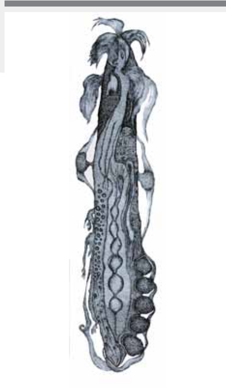
Evelyne Postic, L'épine de pierre , 2009 encre sur toile, 80 x 20cm