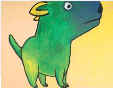
Tagami , Sans titre , mix media sur papier, 79 x 54 cm