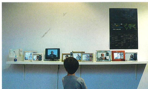
Œuvre de Magali Demazelle, présentée lors de la précédente édition de Show Off, qui devient Variation.