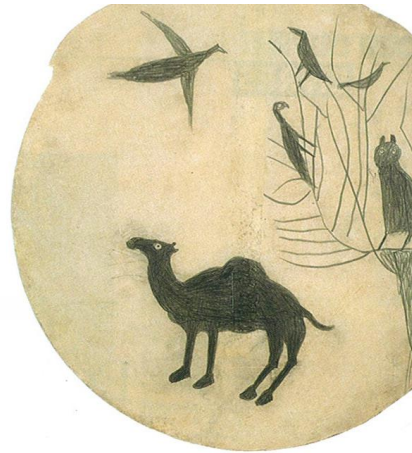
Bill Traylor, Sans titre, 1939-1942, crayon sur carton.

● (Off)icielle , Les Docks, Cité de la mode et du design, 34, quai d'Austerlitz, Paris-13 e , www.officielleartfair.com